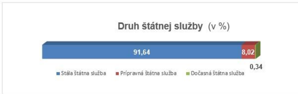
Diagram: Skladba príslušníkov SIS podľa pohlavia, veku, vzdelania a druhu štátnej služby