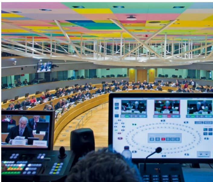
Zasadnutie Rady pre všeobecné záležitosti v Bruseli 7. marca 2017