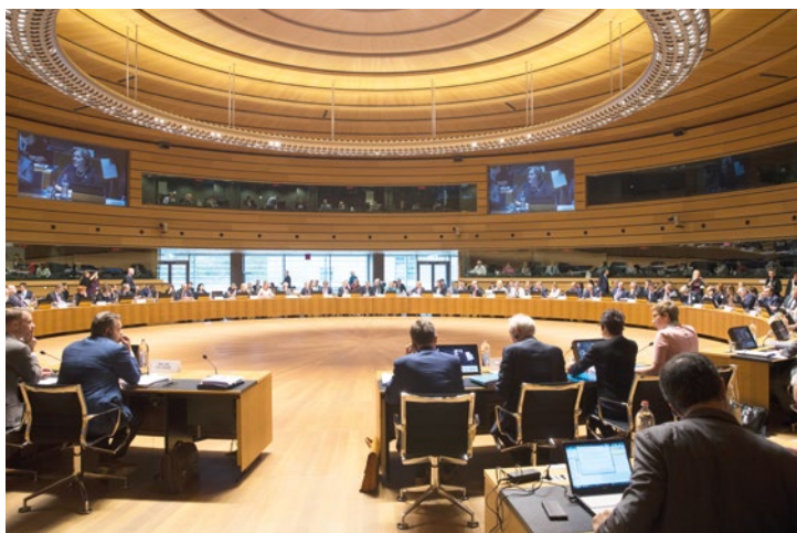
Zasadnutie Rady pre zamestnanosť, sociálnu politiku, zdravie a spotrebiteľské záležitosti v Luxemburgu 23. októbra 2017

Okrem toho Rada tvorí spoločnú zahraničnú a bezpečnostnú politiku EÚ, uzatvára medzinárodné dohody a spoločne s Európskym parlamentom prijíma rozpočet EÚ.