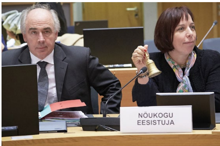
Zasadnutie Rady pre vzdelávanie, mládež, kultúru a šport v Bruseli 20. novembra 2017

Členské štáty, ktoré vykonávajú predsedníctvo, úzko spolupracujú v trojčlenných tímoch, ktoré sa nazývajú „triá“ alebo „trojice“. Táto trojica predsedníctiev stanovuje dlhodobé ciele a pripravuje spoločný program, ktorým sa bude Rada zaoberať počas 18 mesiacov.