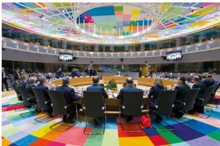
Zasadnutie Európskej rady 9. marca 2017

Európska rada je inštitúciou EÚ, ktorá stanovuje všeobecné smerovanie a priority Európskej únie. Pozostáva z hláv štátov alebo predsedov vlád členských štátov EÚ, predsedu Európskej rady a predsedu Európskej komisie. Európska rada predstavuje najvyššiu úroveň politickej spolupráce medzi členskými štátmi a zasadá aspoň raz za každé 2 až 3 mesiace v Bruseli.