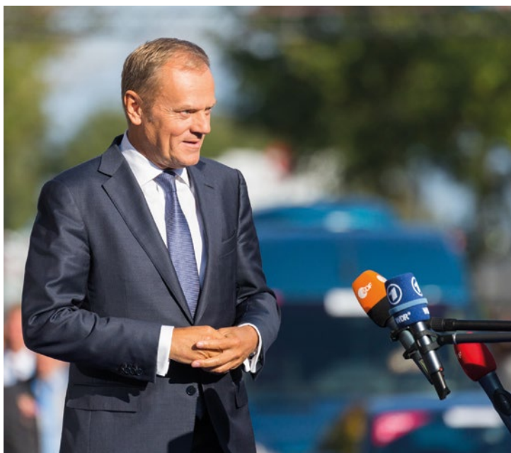
Donald Tusk, predseda Európskej rady

Funkcia predsedu Európskej rady sa ako stála funkcia na plný úväzok vytvorila Lisabonskou zmluvou v roku 2009. Zároveň sa Európska rada viac ako tri desaťročia po svojom vytvorení transformovala na formálnu európsku inštitúciu. Je to dôkazom rastúceho významu Európskej rady. Jej zasadnutia priťahujú veľkú pozornosť médií, o čom svedčí skutočnosť, že o zasadnutiach Európskej rady pravidelne prichádza do Bruselu informovať 1 600 novinárov.